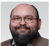
Markus Striedl AfD